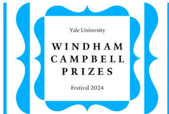
Windham Campbell Prizes 2024 Identity for the literary awards and festival at Yale University.

Przykład prostej, eleganckiej koncepcji plakatu festiwalowego. Element dekoracyjny – niebieska rama, wynika z elementów kroju pisma. Projekt został wymyślony w taki sposób, aby jego elementy dały się łatwo zaangażować.